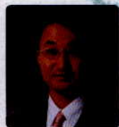
鳥取県知事 平井 伸治

ある日突然、凶悪な犯罪や悪質な交通事故などによって生命を奪われた方々がおられます。そうした犠牲者一人一人の生きた証や、大切な家族を奪われた御遺族の思いと静かに向き合い、人の生命の重さ、尊さを改めて見つめ直す場、それが「生命のメッセージ展 in 鳥取」です。一人でも多くの方に御来場いただき、これ以上悲惨な事件・事故を起こさせない気運が高まることで、誰もが安心して暮らせる安全な社会の大切さを考えるきっかけとなることを願っています。